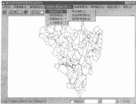
图3 攀枝花市可持续发展评价信息系统主界面