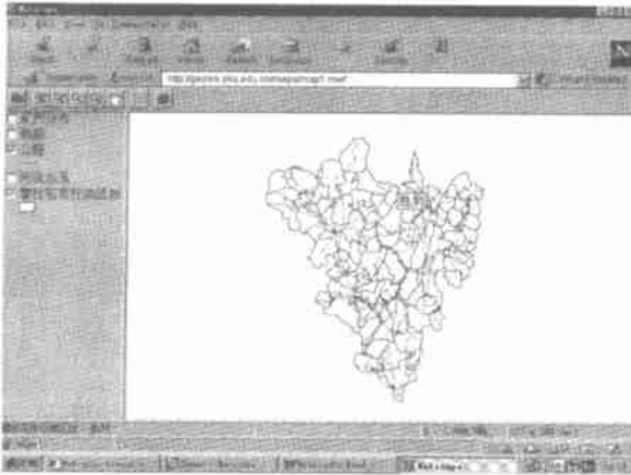
图 4 网上攀枝花市概况示意图

利用 VB 自动将指标数据表及相应图表转换成 HTML 文本,并利用 Microsoft Frontpage 98 建立攀枝花市可持续发展评价信息网站的架构。在使用过程中,用户首先需要下载所需的插件 Plug-In (用于 Netscape Navigator 浏览器) 或 ActiveX 控件 (用于 Internet Explorer 浏览器)。然后就可以对传送到浏览器上的地图进行操作,可以进行缩放、漫游、改变图层的显示状态、利用提示功能查看属性信息等。在用户浏览器上所显示的攀枝花市概况示意图,如图 4 所示。